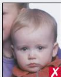
shows another person