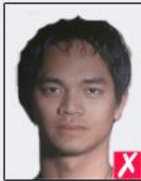
shadows behind head