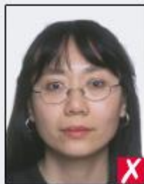
frames covering eyes