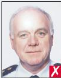
flash reflection on skin