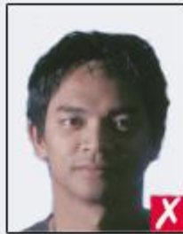
shadows across face