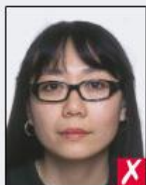
frames too heavy