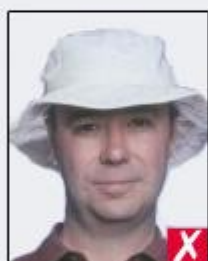
wearing a hat