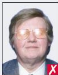
flash reflection on lenses