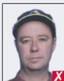
wearing a cap