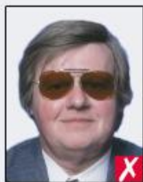
dark tinted lenses