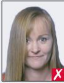
hair across eyes