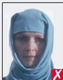
shadows across face