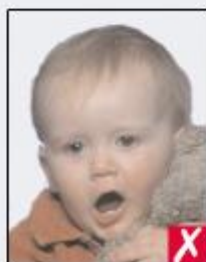
mouth open and toy too close to face